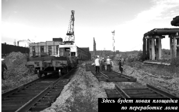
Здесь будет новая площадка по переработке лома