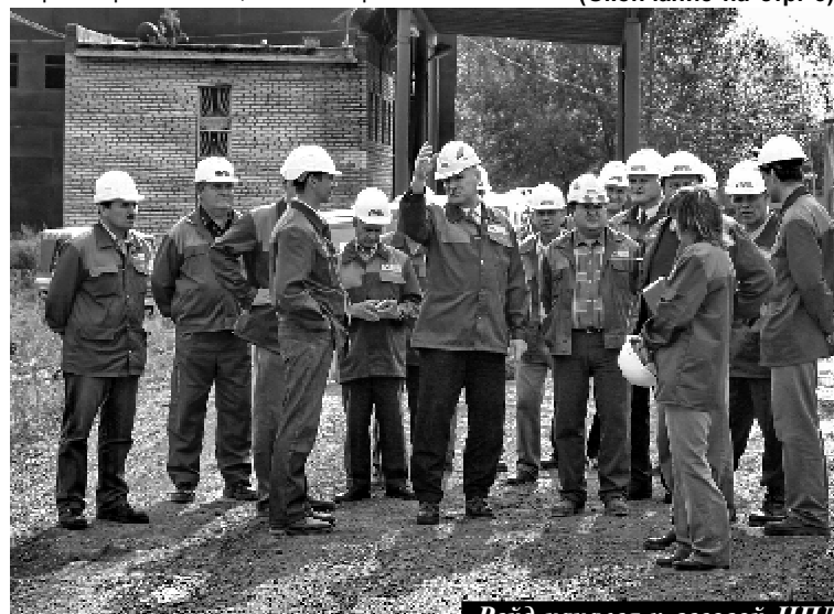
Рейд начался у весовой ЦПЛ

— Пусть в этом году трубы ещё (Окончание на стр. 3).