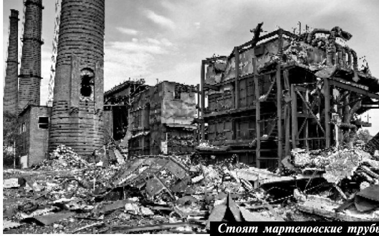
Стоят мартеновские трубы

В настоящее время весьма неприглядный вид имеет территория, расположенная вдоль вновь строящихся объектов рядом с ЭСПЦ № 2 и сортопрокатным цехом. Горы строительного мусора, грунта, остатков деревянной опалубки протянулись на большом расстоянии. Немало потребуются усилия, чтобы очистить эту территорию, привести её в надлежащий порядок.