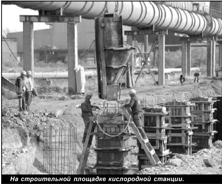
На строительной площадке кислородной станции.