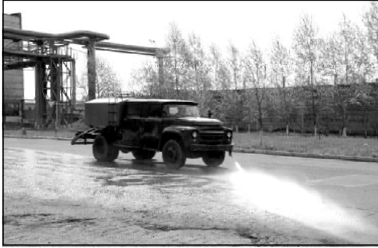
У ЦЕХА БЛАГОУСТРОЙСТВА ОАО «АМУРМЕТАЛЛ» — ГОРЯЧАЯ ПОРА. С НАСТУПЛЕНИЕМ ВЕСНЫ И ПЕРВЫХ ЛЕТНИХ ДНЕЙ РАБОТНИКАМ ЭТОГО ПОДРАЗДЕЛЕНИЯ ПРЕД-

Помимо этого в весенне-летний период будет продолжена работа по высадке летников — рассады цветов и декоративной травы. После 20 мая они будут высажены у центральной проходной и проходной заводоуправления. Для этого в настоящее время