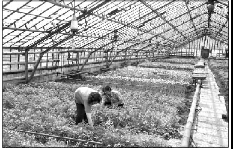
СТОИТ ВЫПОЛНИТЬ БОЛЬШУЮ РАБОТУ ПО БЛАГОУСТРОЙСТВУ И ОЗЕЛЕНЕНИЮ ТЕРРИТОРИИ НАШЕГО ПРЕДПРИЯТИЯ.