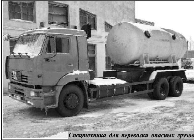
Спецтехника для перевозки опасных грузов

В этом году мы провели часть работ по совершенствованию материальной базы с привлечением УКСиР, часть работ выполнили самостоятельно: провели работы по благоустройству быта наших работников, по ремонту кровли и по благоустройству территории, отремонтировали сва-