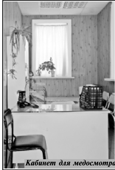
Кабинет для медосмотра

ментов капитального ремонта. Мы своими силами этот ремонт частично выполнили, чтобы зимой было где обслуживать технику. Чтобы довести это помещение до необходимой нормы, оснастить его, требуются материальные затраты что, к сожалению, пока невозможно. А ведь на этом участке 80 процентов техники требует капитального ремонта или списания.