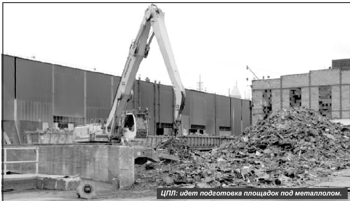
ЦПЛ: идет подготовка площадок под металлолом.

РУКОВОДСТВО ОАО «АМУРМЕТАЛЛ» СЧИТАЕТ, ЧТО В УСЛОВИЯХ КРИЗИСА ДОСТИЖЕНИЕ ВЫСОКИХ ФИНАНСОВЫХ РЕЗУЛЬТАТОВ, СОХРАНЕНИЕ ПРОЧНЫХ ПОЗИЦИЙ НА РЫНКЕ ЧЕРНОЙ МЕТАЛЛУРГИИ ВОЗМОЖНО В ТОМ СЛУЧАЕ, ЕСЛИ КАЖДЫЙ ИЗ НАС - РУКОВОДИТЕЛЬ, СПЕЦИАЛИСТ И РАБОЧИЙ БУДЕТ ВОВЛЕЧЕН В РЕШЕНИЕ ПРОБЛЕМ КАЧЕСТВА И ОБЕСПЕЧЕНИЯ БЕЗОПАСНОСТИ НА СВОЕМ РАБОЧЕМ МЕСТЕ.