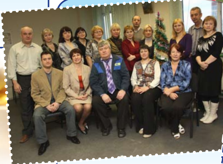
С наилучшими пожеланиями, Коллектив ПКО.

Пусть Новый год стучится к Вам. И счастьем дом наполнится. И все, о чем мечтали Вы, Пусть в этот год исполнится!