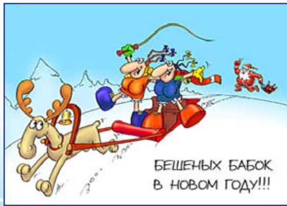
БЕШЕНЫХ БАБОК В НОВОМ ГОДУ!!!