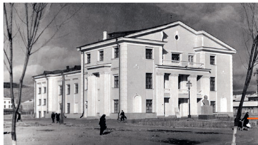
Дом культуры «Металлург»

Всего на средства, выделенные заводом, было построено: поселок «Амурсталь», часть домов на проспекте Ленина и многоквартирные дома в привокзальном районе, дом культуры «Металлург», Ледовый дворец «Металлург», бассейн «Металлург», стадион «Металлург», санаторий-профилакторий «Металлург», училище № 23, поликлиники № 4 и 10, детский дом № 4, пионерский лагерь «Амурчонок», лыжная база на амурстальских сопках.