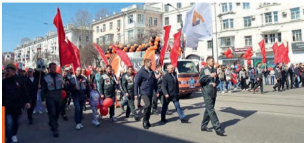
В г. Комсомольске-на-Амуре прошло праздничное шествие, посвященное Дню Победы. От завода «Амурсталь» приняли участие более 230 работников.

наконец смог отпраздновать этот день в очном формате. Не осталась в стороне и «Амурсталь». Об участии наших работников в мероприятиях, посвященных Великой Победе, мы расскажем в нашем репортаже.