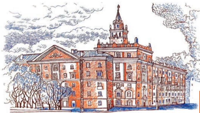
Дом со шпилем

После сдачи в эксплуатацию металлургического завода, теперь уже перед руководством возникла новая задача — обеспечить жильем работников предприятия. Так, в соответствии с решением № 170 исполкома Комсомольского-на-Амуре городского совета депутатов трудящихся от 23 апреля 1958 г., заводу «Амурсталь» для жилищного и культурно-бытового строительства был отведен проспект Ленина, а именно