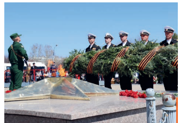
Возложение цветов к Вечному огню

В г. Комсомольске-на-Амуре, недалеко от набережной реки Амур, расположен Мемориальный комплекс землякам-комсомольчанам, павшим в боях за Родину в годы Великой Отечественной войны. Кто-то скажет, что это один из многих мемориалов, расположенных в память о подвиге советского воина по всей территории нашей необъятной страны. Но тот, кто знает историю его создания, всегда будет помнить о его уникальности и особенностях для города.